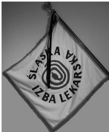
na okładce: sztandar ŚIL